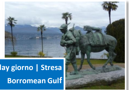
2 nd day giorno | Stresa Borromean Gulf

Morning: buffet breakfast at the hotel. Transfer to Stresa by taxi boat. Time at your leisure for a visit to its historic town centre. The town, a world-wide famous tourist resort, holds its visitors spellbound, thanks to its promenade, offering a delightful landscape, where your gaze sweeps from the near Borromean Isles . Transfer by private boat to Mother Isle , which is the biggest one, fully covered with a botanic garden embellished by rare plants and exotic flowers, and where peacocks, parrots and pheasants live free. Transfer to the Fishermen's Isle , an old medieval village, still inhabited by a few families, who devote themselves to fishing, and characterized by narrow streets and striking corners. Lunch: possibility to have lunch at a local restaurant. Afternoon: Transfer and visit to the Beautiful Isle , built by Count Vitaliano Borromeo in 1632 and composed of a monumental Baroque palace and of the majestic setting of its terraced gardens full of flowers. Back to the hotel in the late afternoon. Evening: dinner and overnight at the hotel.