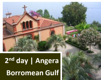
2 nd day | Angera Borromean Gulf

Morning: Buffet breakfast at the hotel. Transfer and guided visit Stronghold of Angera , an ancient fortification perched on a spur Maggiore . Embellished by a medieval-style-garden, it keeps a frescoes, dating back to the end of XIII century. At the end Laveno for sailing to Mother Isle . Self-guided tour of the covered with a botanic garden embellished by rare flowers, and where peacocks, parrots and Then, by private boat, on to the Fishermen's Isle , still inhabited by a few families, who devote and characterized by narrow streets and striking possibility to have lunch at a local restaurant. Afternoon: transfer on the shore of the lake (Verbania) for a self-guided visit to Villa Taranto , one of the most famous botanic complexes enriched with rare world-wide floral species. Transfer to the hotel.