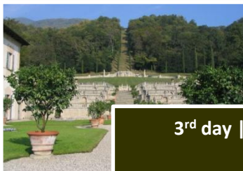
3 rd day | Casalzuigno Varese

Evening: dinner and overnight at the hotel.