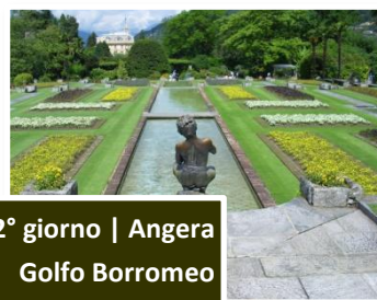
2° giorno | Angera Golfo Borromeo

trasferimento a Laveno e navigazione con alla volta dell' Isola Madre . Visita libera alla più Borromeo , interamente coperta da un giardino piante rare e fiori esotici, nel quale vivono in piena